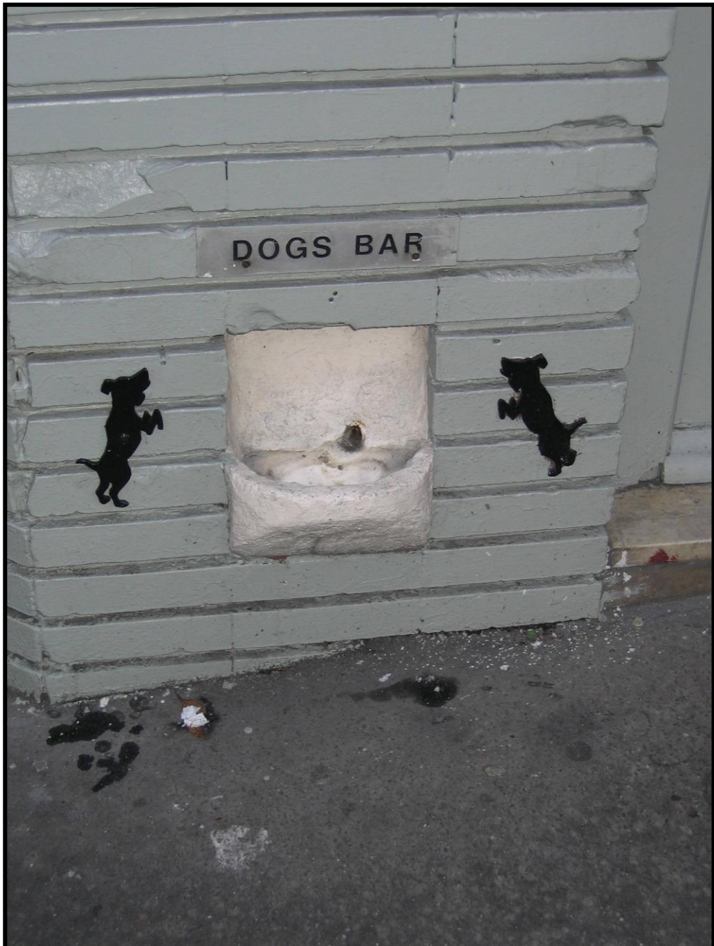
Полка для собак в Париже на углу ул. Блани и ул. Дуэ.