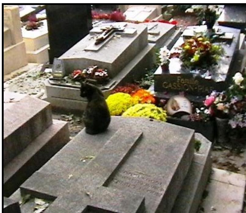
Кошка на кладбище Пер-Лашез в Париже.