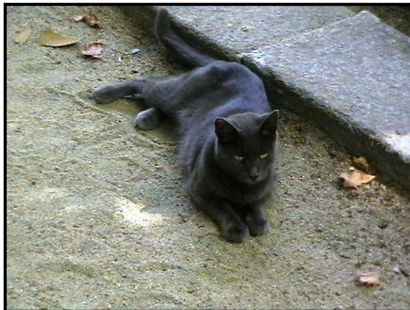
Кот в Королевском Ботаническом саду Мадрида.